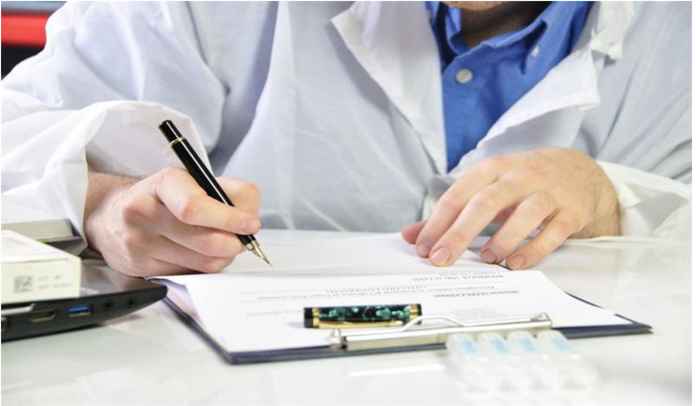
Les médecins traitants

Le médecin traitant a un rôle fondamental pour la personne âgée, pour laquelle il met en place une véritable stratégie de maintien à domicile et son parcours de soins. Au-delà des soins médicaux classiques, il prescrit l'intervention des différents professionnels de santé nécessaires à la santé et au bien-être de la personne âgée.